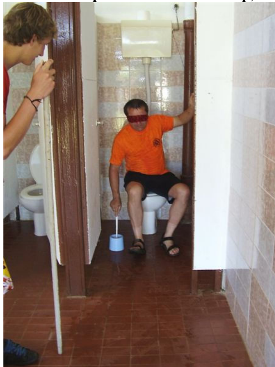
...v vožnji formule 1...