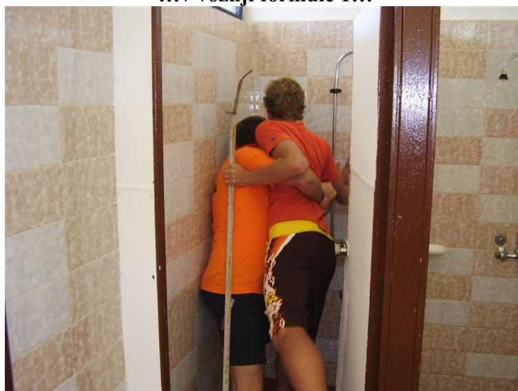
...in v tuširanju svojega angelčka,...