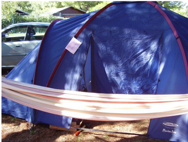
Rezidenca bivšega generala z vsem luksuzom in udobjem.