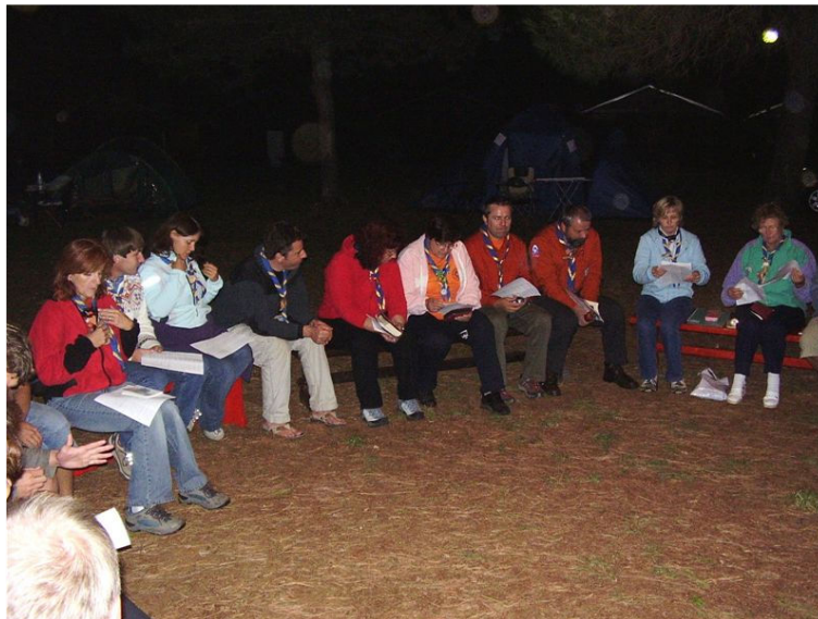
Delavnice je vodila Franja...