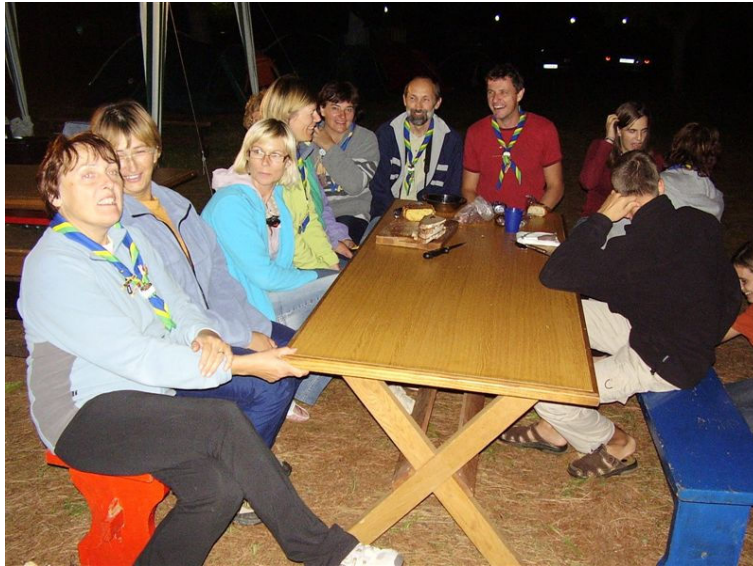
Nato se je prijeten večer zavlekel pozno v noč