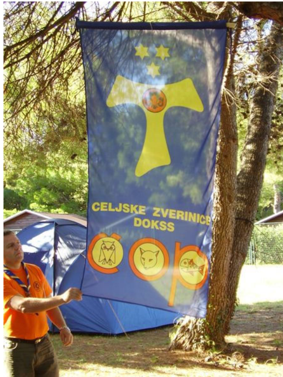
zastava Celjskih zverinic