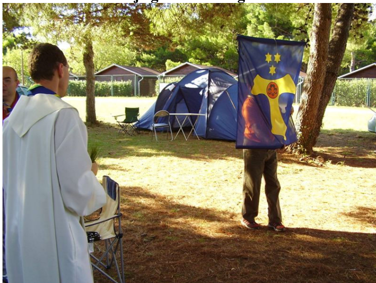
Dvignili smo tudi našo (končno) novo zastavo.