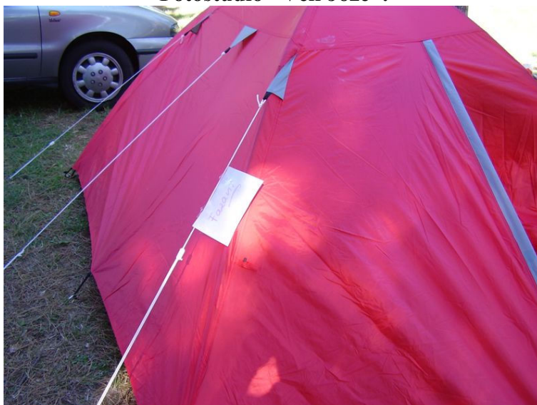
Fazani, gušterji, zelenci, itd – Celje 2 (ha, ha, ha)

Zvečer, ko smo se dokončno vsi utaborili in povečerjali, smo se v krogu zbrali in pričeli duhovne vaje na temo BODI LJUBEZEN.