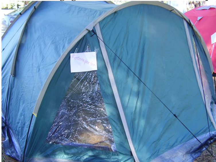
Fotostudio "Veli Jože".